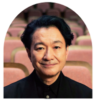
世田谷パブリックシアター 芸術監督 白井晃