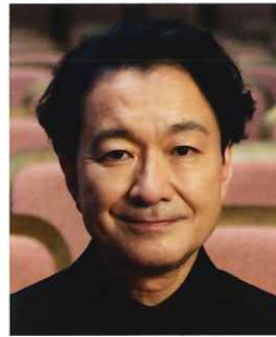
白井 晃 世田谷パブリックシアター芸術監督