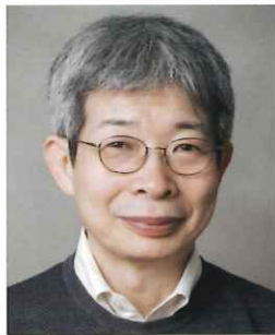
平田 オリザ 劇作家 芸術文化観光専門職大学学長