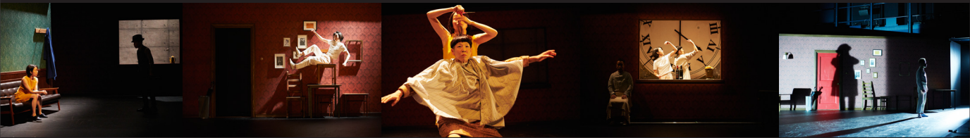
カンパニーデラシネラ『どこまでも世界』(2020年)より