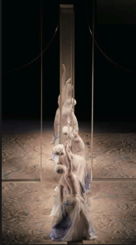
『TOTEM 真空と高み』世界初演(北九州芸術劇場)より

『ARC 薄明・薄暮』以来4年ぶりの新作『TOTEM 真空と高み』、東京初演。虚空を見上げる男たち。中西夏之の「カルテット着陸と着水X」に想を得た美術を中心に男たちを配した天児は、中心と周縁の距離があるほど空間の磁場が強まるとも言いた気である。男たちは注意深く光と影が交差するその場と向き合い、少しずつ、時には大胆に、空間を変容させていく。イメージの磁力は見ているものの脳の中で極点まで高まる。四つに区切られた空間と見え、実のところはパラレルワールドで遊ぶ男たちの一炊の夢。