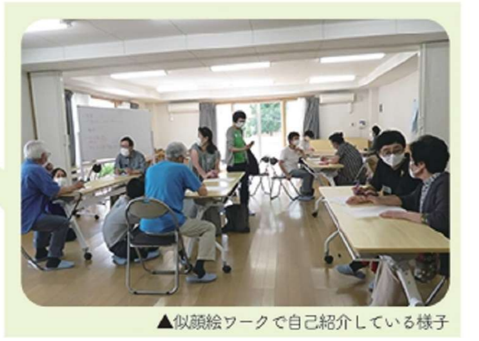
▲仮顔絵ワークで自己紹介している様子

今年度初の表現クラブには、新しい参加者も多く、多様な出会いの場となりました。海外からいらして、地域に友人がおらず困っていた方に参加者の皆さんが色々な情報を伝える姿もありました。作られた作品を通して、過去にあった辛い出来事をお話くださる方もいて、「アート」が人の心を溶かしていくことを実感する時間となりました。