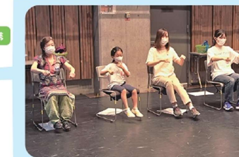
▲「雨の日の思い出」をダンスで表現(自転車の動きをみんなで振付している様子)

このゼミでは、演劇WSの進行を目指している人たちが集まり、絵本の世界を足がかりに、自身の現場で実施する『絵本をつかった演劇WSプログラム』を立案しています。持ち寄ったアイデアを実際に試しながら、試行錯誤しています。