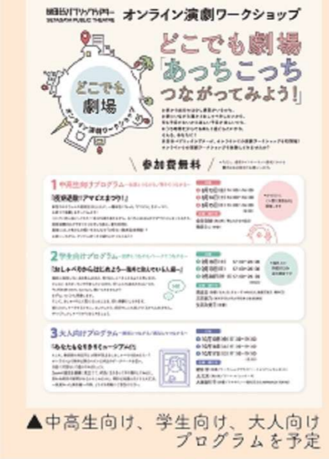
▲中高生向け、学生向け、大人向けプログラムを予定

2021年4月23日(金)に第3回目の緊急事態宣言が発令され、その後、5月7日(金)の延長を受け、世田谷パブリックシアター、シアタートラムともに5月31日(月)まで臨時休館となりました。そのため5月23日(日)予定していた『デイ・イン・ザ・シアター』も中止となりました。しかし、演劇WSラボの活動はオンラインでのミーティングなども活用しながら続け、今夏予定されているオンライン演劇WSや夏休みの演劇WSへとつながることになりました。