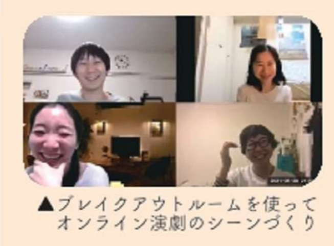
▲ブレイクアウトルームを使ってオンライン演劇のシーンづくり