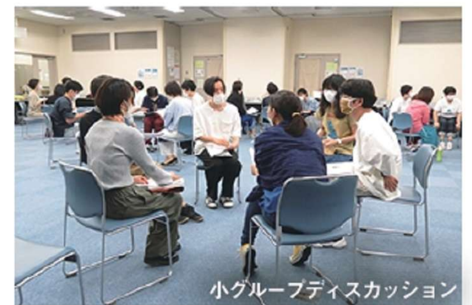
小グループディスカッション