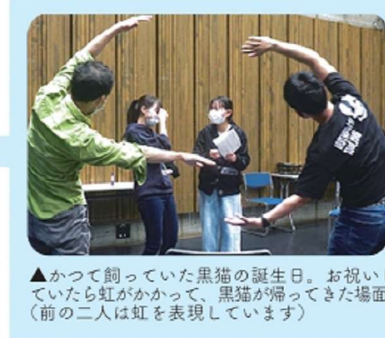
▲かつて飼っていた黒猫の誕生日。お祝いしていたら虹がかかって、黒猫が帰ってきた場面。(前の二人は虹を表現しています)