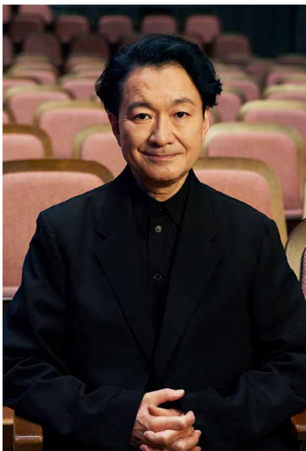
世田谷パブリックシアター芸術監督