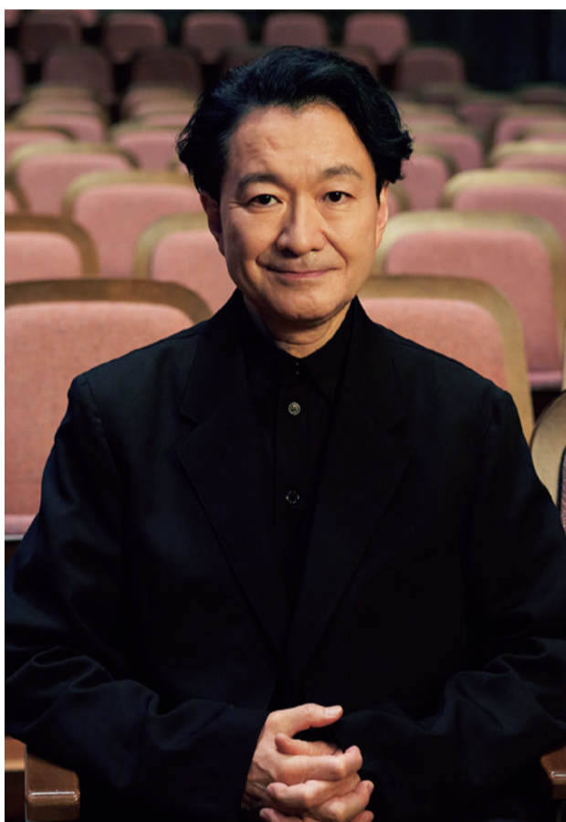
世田谷パブリックシアター芸術監督