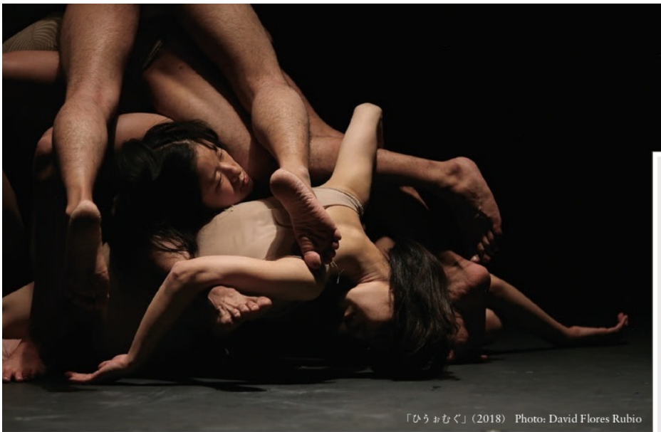
「ひろむむく」(2018)