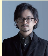
真鍋 大度 (まなべ だいと)

1966 年東京都生まれ。狂言師。人間国宝・野村万作の長男。重要無形文化財総合指定者。2002 年より世田谷パブリックシアター芸術監督を務める。国内外で多数の狂言・能公演に参加、普及に貢献する一方、現代劇や映画・テレビドラマにも出演。芸術祭新人賞・優秀賞、芸術選奨文部科学大臣新人賞、朝日舞台芸術賞、紀伊國屋演劇賞等を受賞。2017 年の「千鶴の記」再演で毎日芸術賞千田是也賞、読売演劇大賞最優秀作品賞を受賞。東京 2020 オリンピック・パラリンピック競技大会開会式・閉会式のチーフ・エグゼクティブ・クリエイティブ・ディレクターに就任。