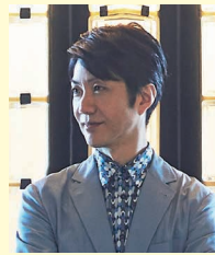
野村萬斎 (のむら まんさい)

1966 年東京都生まれ。狂言師。人間国宝・野村万作の長男。重要無形文化財総合指定者。2002 年より世田谷パブリックシアター芸術監督を務める。国内外で多数の狂言・能公演に参加、普及に貢献する一方、現代劇や映画・テレビドラマにも出演。芸術祭新人賞・優秀賞、芸術選奨文部科学大臣新人賞、朝日舞台芸術賞、紀伊國屋演劇賞等を受賞。2017 年の「千鶴の記」再演で毎日芸術賞千田是也賞、読売演劇大賞最優秀作品賞を受賞。東京 2020 オリンピック・パラリンピック競技大会開会式・閉会式のチーフ・エグゼクティブ・クリエイティブ・ディレクターに就任。