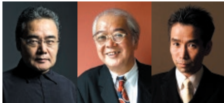
岩松 了 マキノノゾミ 小野寺修二

岩松了◎劇作家・演出家・俳優 長崎県出身。1980年代後半から劇作家、演出家として頭角をあらわし、1989年、『蒲団と達磨』で岸田國士戯曲賞、1993年紀伊國屋演劇賞、1998年『テレビ・デイズ』で読売文学賞、2018年『薄い桃色のかたまり』で鶴屋南北戯曲賞と、戯曲によって相次いで受賞を重ねている。1990年代からはテレビドラマや映画の脚本家・監督としても活躍。