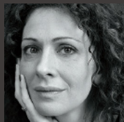
Ksenia Rappoport クセニア・ラポポルト