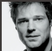
Danila Kozlovsky ダニラ・コズロフスキー