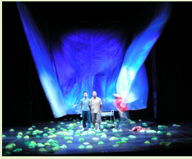
2008年作品「イカサの母」より