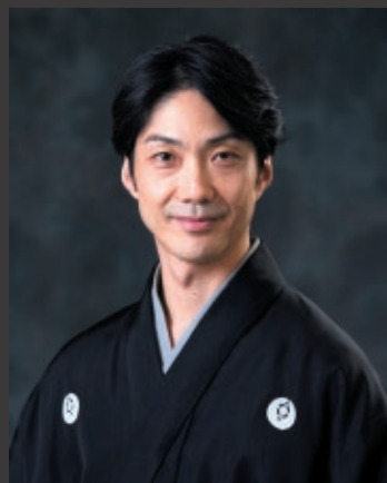
世田谷パブリックシアター 芸術監督 野村萬斎

教育とエンターテインメントが一体になった企画は、将来の芸術愛好家を増やす先行投資みたいなものです。日本の文化を発展させていくためには、長い目で教育を考え、大人と子供が協力することが不可欠。作り手、演じ手、観客の三位一体がうまく機能しない限り、良い劇場は成り立たないでしょう。まだ劇場にいらしたことがないかたは、どうぞ、勇気を出して足を踏み入れてください。お待ちしております！