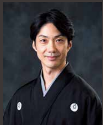
世田谷パブリックシアター 芸術監督 野村萬斎