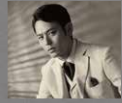
妻夫木 聡 SATOSHI TSUMABUKI