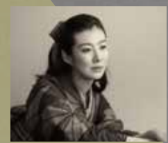
ともさかりえ RIE TOMOSAKA