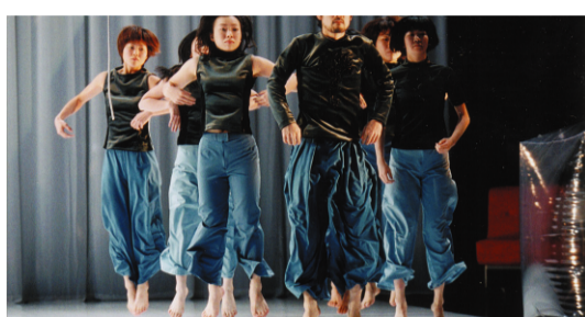
2002年「くるみ割り人形」