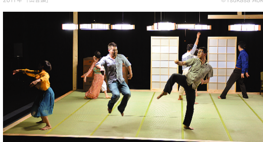
2013年「麻痺を引き出し 紙船」