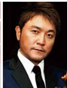
チェロ 古川展生 Nobuo Furukawa