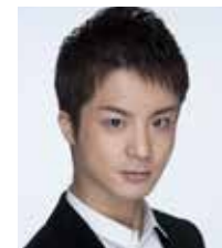
歌手、俳優 田代万里生 Mrio Tashiro