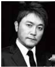
古川展生 (チェロ) Nobuo Furukawa

純邦楽【尺八:藤原道山(ふじわらどうざん)】、クラシック【チェロ:古川展生(ふるかわのぶお)】、ポップス【ピアノ:妹尾武(せのおたけし)】、異なるジャンルで活躍しているこの三人のトップアーティストが意気投合し、2007年に結成。日本の伝統と感性を大切にしながら、様々な音楽のルーツを取り入れ、新しいインストゥルメンタルの世界を創造している。演奏家としての抜群の技術はもちろん、コンポーザーとしての評価も高く、TBS系「NEWS 23」をはじめテレビ番組のテーマ曲、ドラマやCM音楽、舞台音楽なども手掛ける。2013年8月には、『OTOTABI-音楽旅-』を発表、これまでに5枚のアルバムをリリース。今作のアルバム『cuisine de classic』は、古武道ならではの選曲にアレンジをほどこしたクラシックの名作を中心に収録。コンサート活動も全国各地で数多く行っており、2015年9月には、テレビ番組とのコラボによる「和風総本家コンサート in 大阪」を開催した。http://www.kobudo-otoemaki.net/