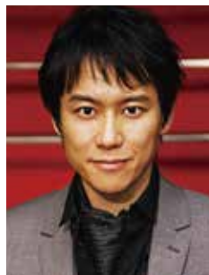
尺八 藤原道山 Dozan Fujiwara