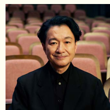
世田谷パブリックシアター 芸術監督