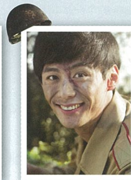
ピョン・ジュファ役 (北の兵士)

「兄弟は勇敢だった」「シングルス」 「サビ・ター〜愛が運んだ愛〜」 「キム・ジョンウク探し」「チョンガンネ」 「オー!あなたが寝てる間に」