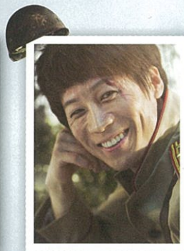
イ・チャンソプ役 (北の隊長)

「インダンス恋歌」「春のめざめ」 「ブラック・メリー・ホピンス」 「女神様が見ている」「スリル・ミー」 「恋の駆け引きの誕生」「M.butterfly」