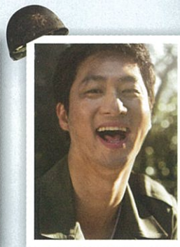
シン・ソック役 (南の兵士)

「アガサ」「オールモストメイン」 「私とおじいちゃん」 「リー・ガリー・プロント」 「我が心のアンナブルナ」