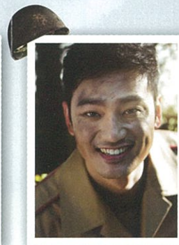
チョ・ドンヒョン役 (北の兵士)

「バンジー・ジャンプする」 「ヒストリー・ボーイズ」 「スベシャルター」 「チョンガンネ」