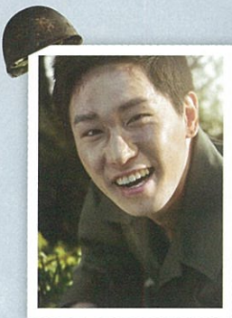
ハン・ヨンボム役 (南の隊長)