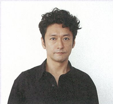
石丸 幹二 Ishimaru Kanji

1990年、ミュージカル『オペラ座の怪人』でデビュー。現在は舞台、映像、音楽と多方面に活動する。近年の出演作に、舞台『レディ・ベス』『もっと泣いてよフラッパー』『ジキル&ハイド』、サイトウ・キネン・フェスティバル『兵士の物語』等。映像：ドラマ「ルーズヴェルト・ゲーム」「半沢直樹」（共にTBS）、「酔いどれ小籐次」（NHK）等、映画「時をかける少女」等。CD：「Love Songs」、「kanji ishimaru」等。ナレーション：「目撃！日本列島」（NHK）、「アンドレアス・グルスキー展」、「ラファエル前派展」。朗読：「ブラテロとわたし」、「小象パールの物語」等。2015年NHK大河ドラマ「花燃ゆ」に長州藩重鎮・周布政之助役で出演予定。 http://ishimaru-kanji.com