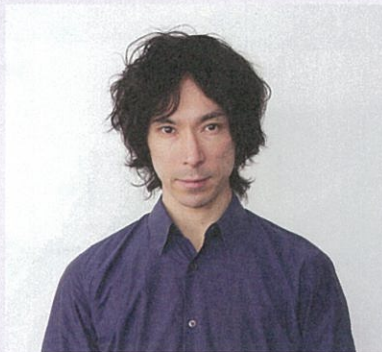
首藤 康之 Shuto Yasuyuki

1990年、ミュージカル『オペラ座の怪人』でデビュー。現在は舞台、映像、音楽と多方面に活動する。近年の出演作に、舞台『レディ・ベス』『もっと泣いてよフラッパー』『ジキル&ハイド』、サイトウ・キネン・フェスティバル『兵士の物語』等。映像：ドラマ「ルーズヴェルト・ゲーム」「半沢直樹」（共にTBS）、「酔いどれ小籐次」（NHK）等、映画「時をかける少女」等。CD：「Love Songs」、「kanji ishimaru」等。ナレーション：「目撃！日本列島」（NHK）、「アンドレアス・グルスキー展」、「ラファエル前派展」。朗読：「ブラテロとわたし」、「小象パールの物語」等。2015年NHK大河ドラマ「花燃ゆ」に長州藩重鎮・周布政之助役で出演予定。 http://ishimaru-kanji.com